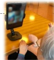
オンライン面会のご様子

上記条件に合わないご面会を希望される場合は病棟にご相談ください。また、直接のご面会以外にも、LINEやFaceTimeを使ったオンライン面会を承っております。初回は機器の設定が必要ですので、新規お申し込みの場合は希望日の前日までにご連絡ください。