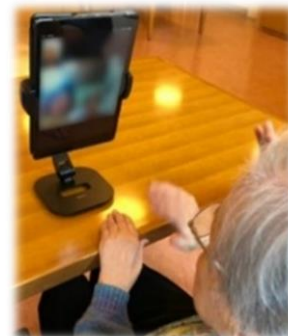
オンライン面会のご様子

患者様のご様子やご病状などご心配や気になることがありましたら病棟もしくは医療相談室までお気軽にお問い合わせください。